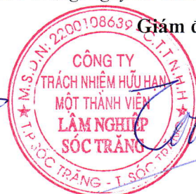
Nguyễn Khánh Toàn