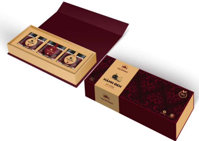
PHỐI CẢNH 3D - PHƯƠNG ÁN 1