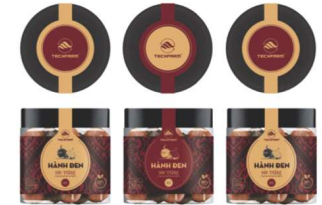
• TEM DÁN LỖ - Lỗ thủy tinh - Tem decan in 4 màu, cán mờ