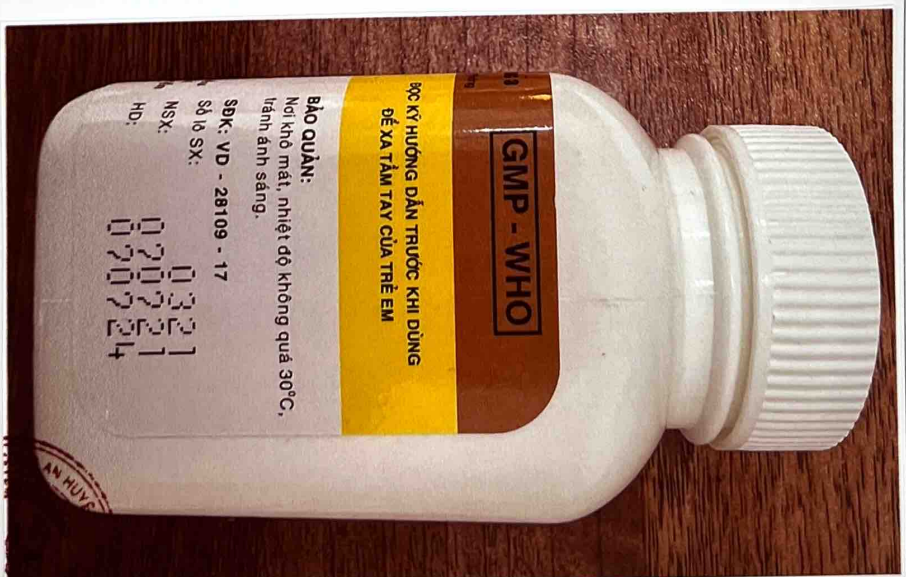
Mặt bên trái của hộp thuốc

14:24 SYL_soctrang_vn Y tế Soc Trang CỘNG HÒA XÃ HỘI CHỦ NGHĨA VIỆT NAM Độc lập - Tự do - Hạnh phúc HỒI * VÀI * MỘT * TRƯA * AN HUY