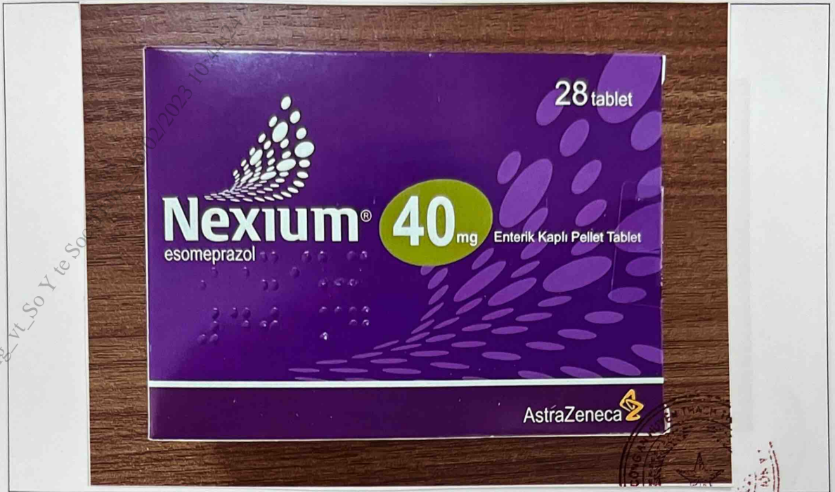
Mặt trước hộp thuốc