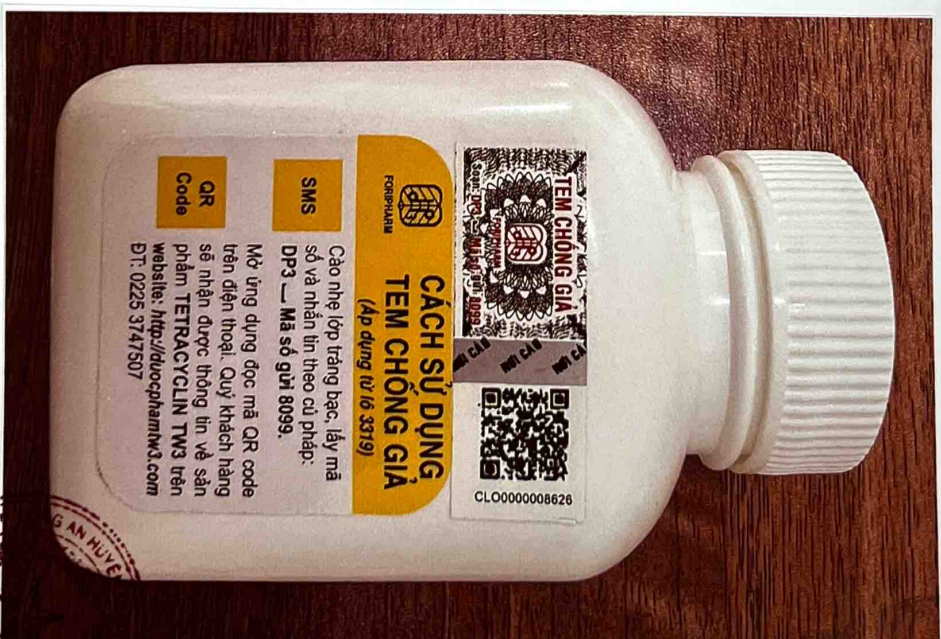
Mặt sau của hộp thuốc