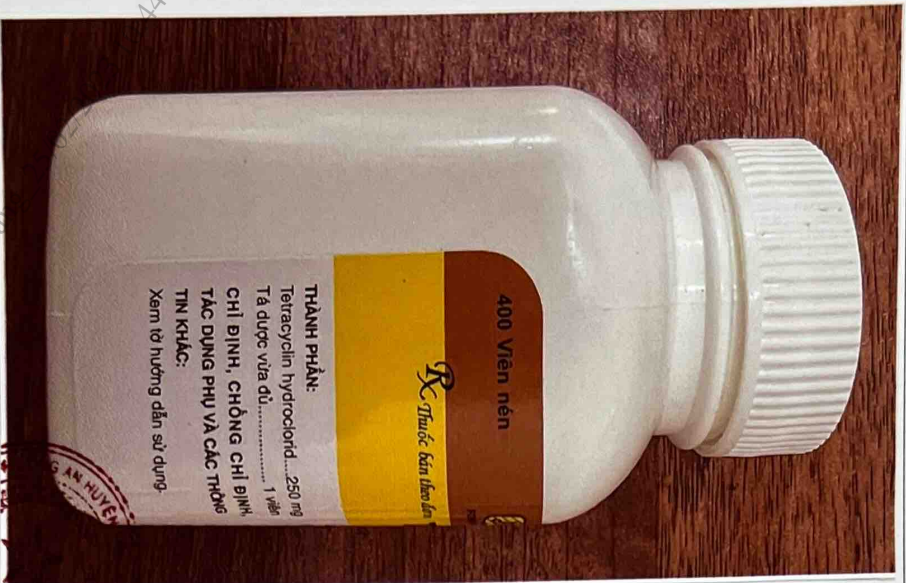
Mặt bên phải của hộp thuốc