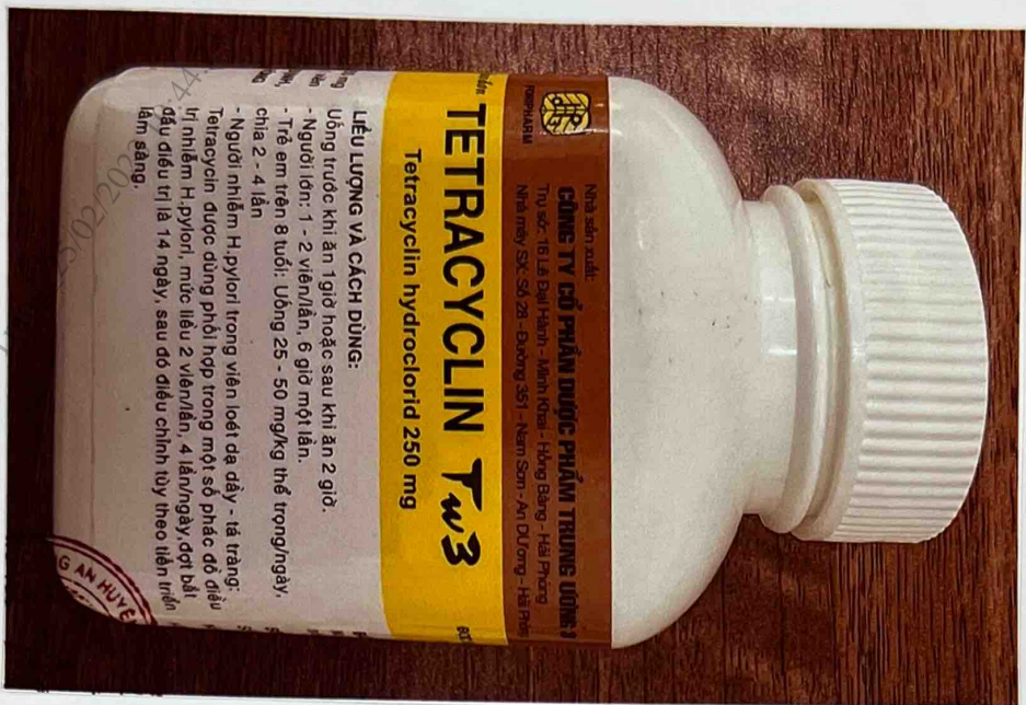
Mặt trước của hộp thuốc