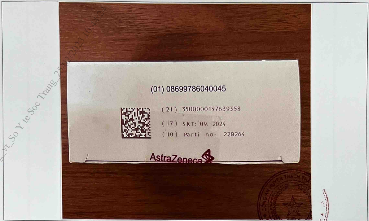
Mặt trên hộp thuốc