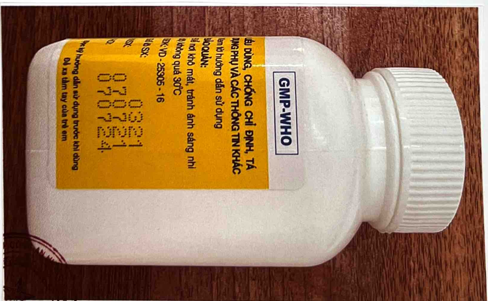
Mặt bên trái của hộp thuốc

SYT soctrang - 125 Số Y tế Trang 25/02/2023 10 HỘI Y HẠNG CỘNG HÒA XÃ HỘI CHỦ NGHĨA VIỆT NAM ĐIỀU TRA