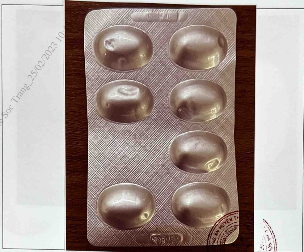
Mặt trước vỉ thuốc

syl_soctrang_vt_So Y te Soc Trang_25/02/2023 10