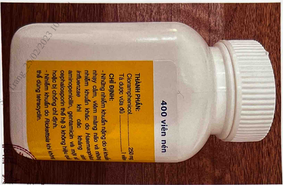
Mặt bên phải của hộp thuốc