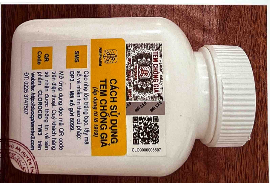
Mặt sau của hộp thuốc

25/02/2023 SYT_soctrang_vn te Soc T HUYỆN CỘNG HÒA XÃ HỘI CHỦ NGHĨA VIỆT NAM Độc lập - Tự do - Hạnh phúc HUYỆN AN HUYỆN TH