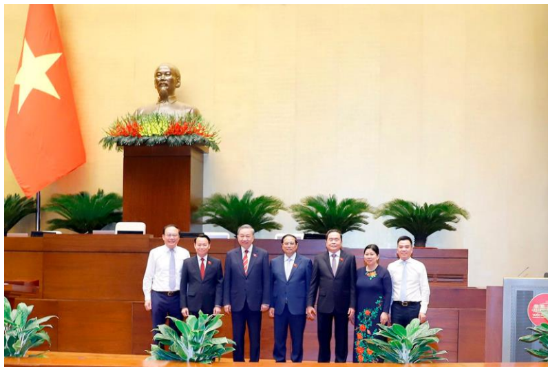
Tổng Bí thư, Chủ tịch nước Tô Lâm; Thủ tướng Chính phủ Phạm Minh Chính Chủ tịch Quốc hội Trần Thanh Mẫn và lãnh đạo Bộ TN&MT chụp ảnh lưu niệm cùng tân Bộ trưởng Đỗ Đức Duy

Ngày 26/8, tại Kỳ họp bất thường lần thứ 8, Quốc hội khóa XV, với đa số đại biểu tán thành, Quốc hội đã thông qua Nghị quyết phê chuẩn bổ nhiệm ông Đỗ Đức Duy, Bí thư Tỉnh ủy Yên Bái, làm Bộ trưởng Bộ Tài nguyên và Môi trường nhiệm kỳ 2021 - 2026 với kết quả biểu quyết 426/426 đại biểu có mặt tán thành.