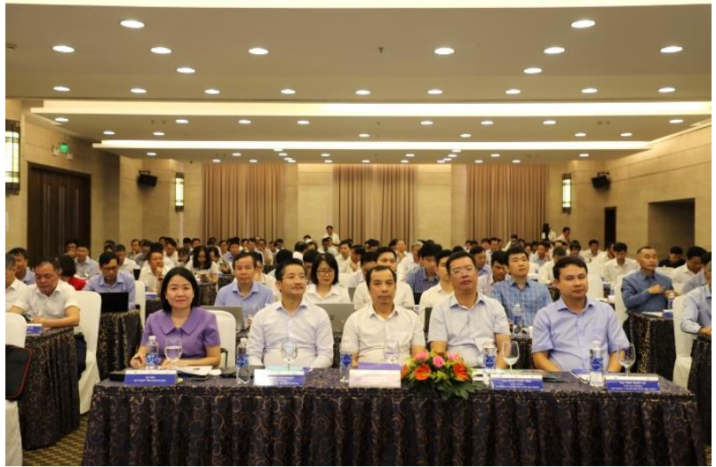
Lãnh đạo các đơn vị: Cục Quản lý tài nguyên nước; Cục kỹ thuật An toàn và Môi trường Công nghiệp, và Tập đoàn Điện lực Việt Nam tham dự Hội thảo

Luật tài nguyên nước 2023 cũng quy định, việc đầu tư, xây dựng đập, hồ chứa trên sông, suối phải phù hợp với quy hoạch về tài nguyên nước, quy hoạch tỉnh, quy hoạch có tính chất kỹ thuật, chuyên ngành có nội dung khai thác, sử dụng tài nguyên nước và phải bảo đảm đa mục tiêu, chủ động tích trữ nước, điều hoà, phân phối, phục hồi, phát triển nguồn nước (khoản 1, Điều 50); Việc đầu tư, xây dựng, quản lý, vận hành công trình đập, hồ chứa và quản lý khai thác, sử dụng nguồn nước từ hồ chứa phải bảo đảm an toàn đập, hồ chứa (khoản 2, Điều 50); Việc khai thác, sử dụng nguồn nước từ hồ chứa và các hoạt động trong hành lang bảo vệ nguồn nước phải bảo đảm yêu cầu về bảo vệ, khai thác, sử dụng và phòng, chống và khắc phục tác hại do nước gây ra; Việc vận hành đập, hồ