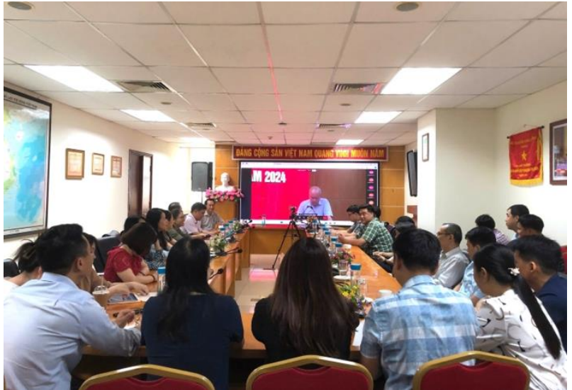
Đảng ủy Cục Quản lý tài nguyên nước kết nối Hội nghị trực tuyến

Tại Hội nghị, các đại biểu đã nghe đồng chí Đỗ Thành Trung, Thứ trưởng Bộ Kế hoạch và Đầu tư thông tin chuyên đề: "Tình hình kinh tế - xã hội 7 tháng năm 2024; kế hoạch phát triển kinh tế - xã hội những tháng cuối năm 2024";