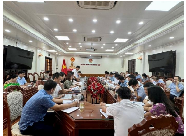
Toàn cảnh cuộc họp

Tại buổi làm việc, Đoàn công tác của FAO và Cục Quản lý tài nguyên nước cũng đã trao đổi với đại diện lãnh đạo các