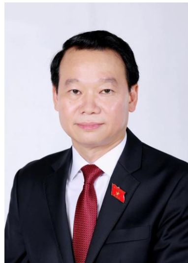
Tân Bộ trưởng Bộ Tài nguyên và Môi trường Đỗ Đức Duy

Ô ng Đỗ Đức Duy sinh ngày 20/5/1970, quê quán xã Thụy Văn, huyện Thái Thụy, tỉnh Thái Bình. Ông có trình độ chuyên môn là Thạc sỹ Xây dựng; trình độ lý luận cao cấp; Ông là Ủy viên Trung ương Đảng khóa XIII; Đại biểu Quốc hội Khóa XV, Trưởng đoàn đại biểu Quốc hội tỉnh Yên Bái.