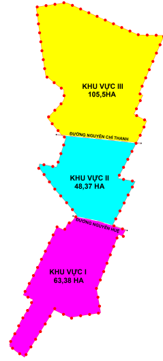
SƠ ĐỒ PHÂN CHIA KHU VỰC QUY HOẠCH