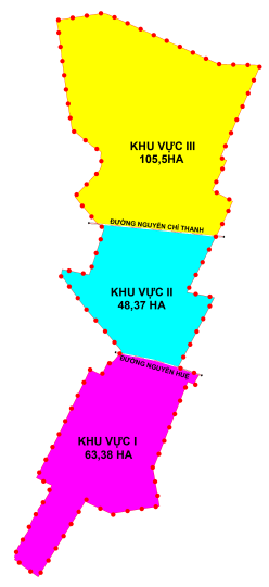
SƠ ĐỒ PHÂN CHIA KHU VỰC QUY HOẠCH