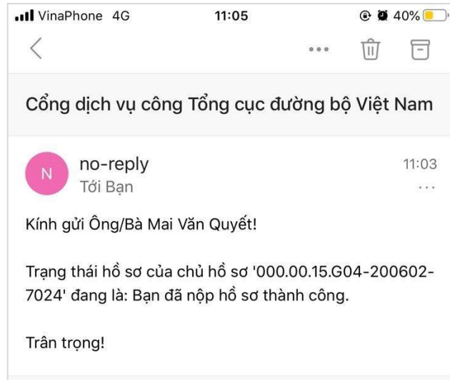
Hình 16. Thông tin trạng thái hồ sơ được gửi về email đã cũng cấp

Đồng thời, người dân nhận được email thông báo nộp hồ sơ thành công: