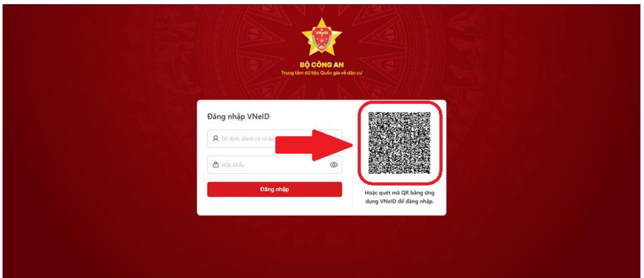
Hình 3. Thực hiện quét mã QR để đăng nhập hoặc sử dụng Số định danh cá nhân và mật khẩu để đăng nhập (Nhập mã PASSCODE trên thiết bị di động đang đăng nhập VneID)