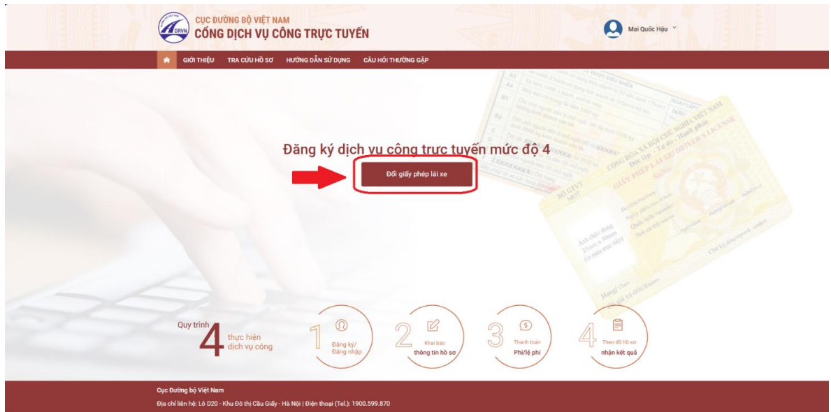
Hình 4. Chọn chức năng “Đổi giấy phép lái xe”

Bước 2: Trên giao diện trang chủ, người dân lựa chọn dịch vụ “ Đổi giấy phép lái xe ”.